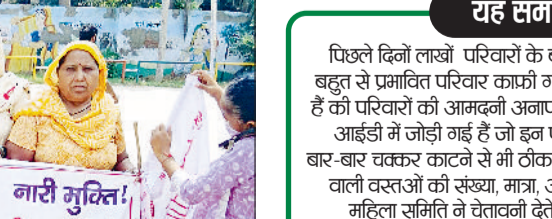
मिवाणी। मांगों को लेकर प्रदर्शन करती जनवादी महिला समिति की सदस्य।

समय को हर परिवार खुशी और उत्साह के साथ मनाया चाहता है। परंतु गरीब परिवारों के लिए यह बेहद मुश्किल समय होता है। महंगाई से खाने-पीने की वस्तुओं के दाम आसमान छू रहे हैं दूसरी तरफ सार्वजनिक वितरण प्रणाली को सिकोड़ा जा रहा है।