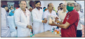
बवानीखेड़ा। गांव जमालपुर के सीएचसी केंद्र में स्वस्थ नारी सशक्त परिवार के तहत कार्यक्रम में मौजूद।