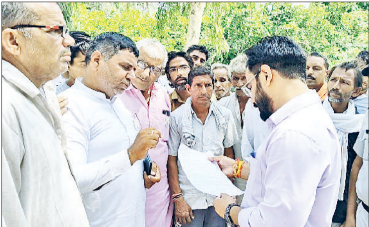
भिवानी। सरकारी खरीद शुरू करवाए जाने की मांग को लेकर मांगपत्र सौंपते हुए और सचिवालय परिसर में प्रदर्शन करते हुए।