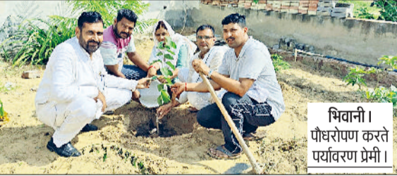
भिवानी। पौधरोपण करते पर्यावरण प्रेमी।