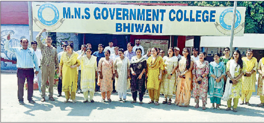
भिवानी। नारेबाजी करते शिक्षक।

बुधवार को विरोध प्रदर्शन करते हुए महाविद्यालय के प्राध्यापकों ने