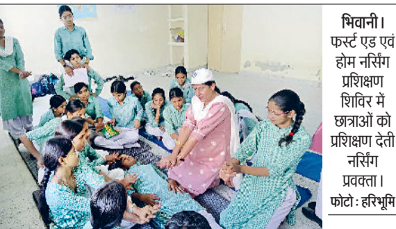
भिवानी। फर्स्ट एड एवं होम नर्सिंग प्रशिक्षण शिविर में छात्राओं को प्रशिक्षण देती नर्सिंग प्रवक्ता।