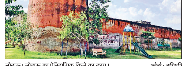
लोहारू। लोहारू का ऐतिहासिक किले का दृश्य।

लोहारू के ऐतिहासिक किले का होगा जीर्णोद्धार: धर्मबीर सिंह